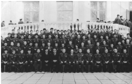
Делегаты XXV комсомольской конференции К Турк ВО